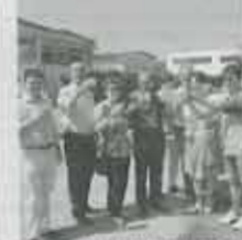
Il brindisi d'inaugurazione

UMBERTIDE - Il servizio di disinfestazione sarà effettuato lunedì nel capoluogo, a Pietranonico e Palazzetto Nese, martedì nel resto del territorio comunale, dalle 23.30 in poi. Si raccomanda di tenere chiuse le finestre e di ricoverare in casa gli animali domestici.