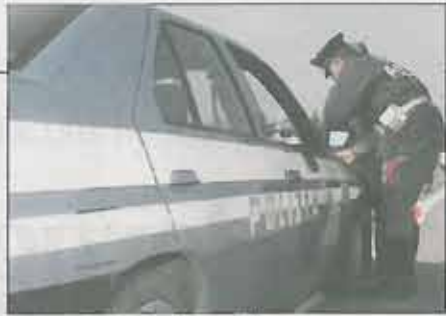
Tante le multe nel week end di ritorno dalle vacanze