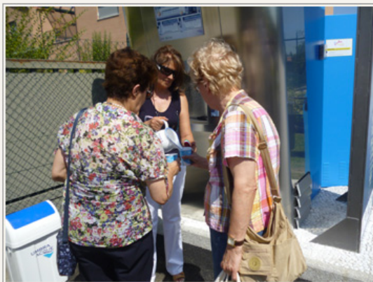
Poco dopo l'inaugurazione, la gente comincia a bere