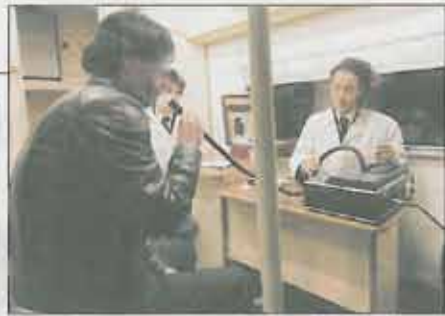
Controlli effettuati con i precursori anti alcol su centinaia di autisti

La questione Provi Da Terni l'invia a fare più pres per il giardino