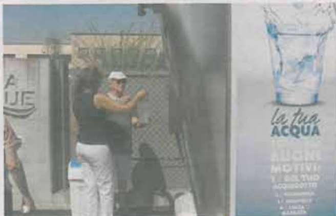
PRIMI UTENTI L'erogatore attivato a Città di Castello