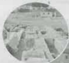
Palazzo Vitelli alla cannoniera. Nel fondo, gli scavi dell'area ex Fat

La giornata è inserita nell'ambito della "Festa della scartocciata", organizzata dall'associazione "La giovane terza età" di Pistrino con la quale l'Amministrazione collabora da anni.