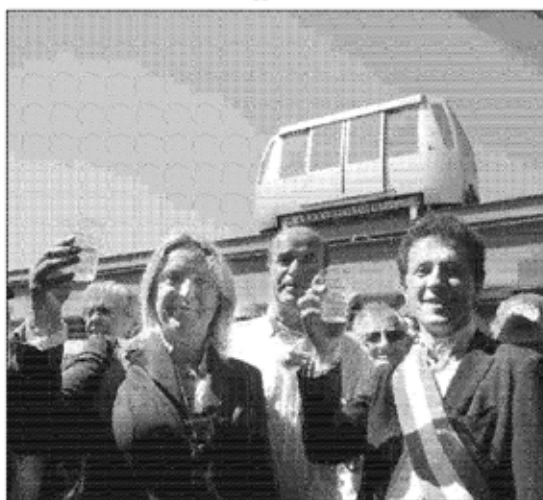
Pian di Massiano ieri l'inaugurazione dell'erogatore