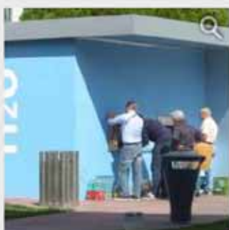
Fontanella a Pian di Massiano