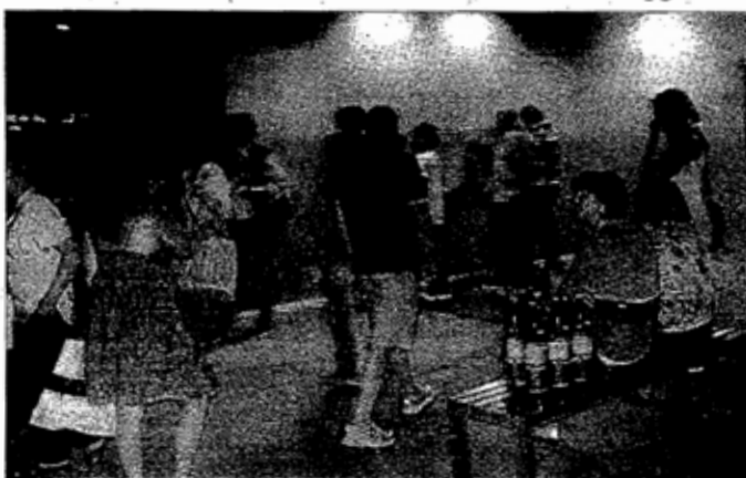
Fontanelle In attesa per fare il pieno di acqua refrigerata, gassata o naturale

teglie". Qualcuno lascia un bonus di qualche litro per chi viene dopo (dato che la macchina non dà resto). C'è chi arriva invece con la chivetta precaricata, con la quale c'è il sistema a scalare e non si perde un centesimo. C'è anche chi non crede che l'acqua sia proprio quella proveniente da Nocera. O, almeno, non "solo" quella. Si sa che l'acqua perugina è un mix di Nocera, Scirca, Cannara e osant'altro. Umbria Ac-