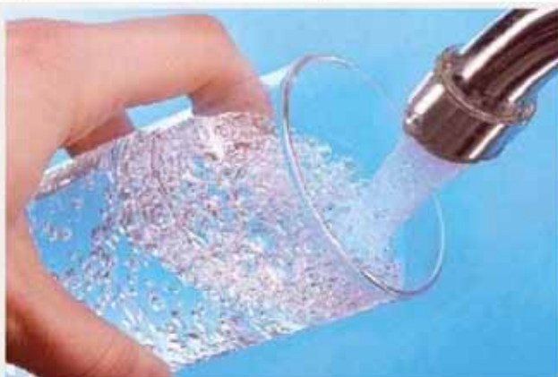
Entro il prossimo anno aprirà un altro punto di erogazione a Ponte San Giovanni

Ogni mese vengono erogati oltre 300mila litri di acqua